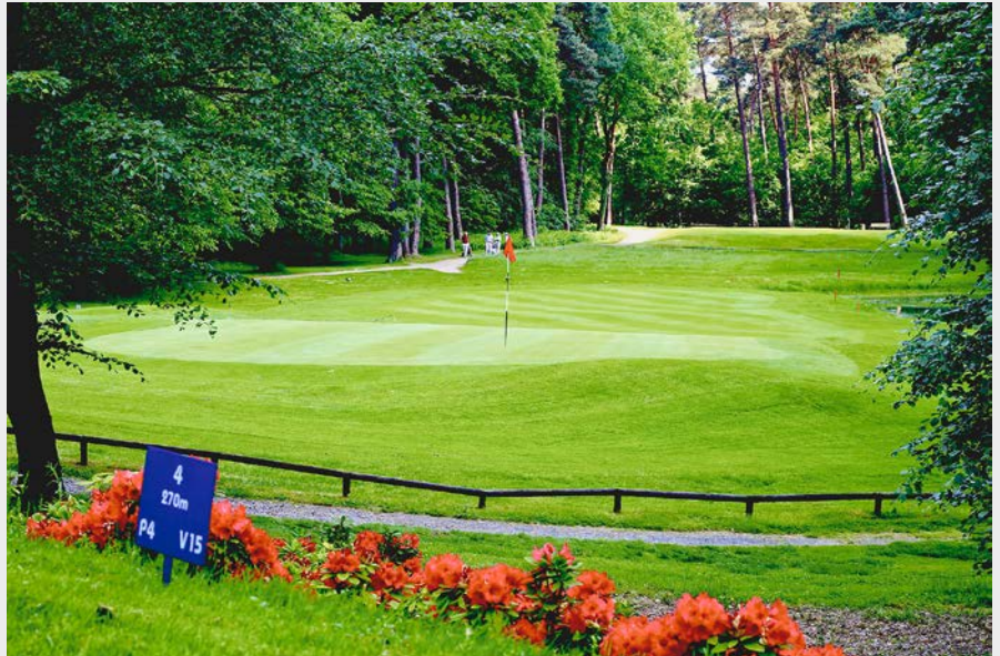
Der Golf- und Land-Club Köln hat die Atmosphäre eines privaten Golfclubs.