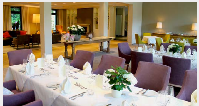
... und bietet nun helle und freundliche Räume wo zuvor englisch-rustikales Ambiente vorherrschte.