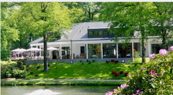
Das Clubhaus wurde 2013 renoviert ...

in Deutschland. Der Grundstein dafür wurde bereits in den 40er Jahren gelegt: Hier wurde dem Club im Zuge des Autobahnbaus eine Ausgleichfläche auf der anderen Rheinseite in Bergisch Gladbach angeboten. Zum Glück entschied sich der Club dazu, diese Fläche für einen Neubau zu nutzen und von einer ebenfalls angebotenen Ausgleichszahlung für den Wegfall des alten Geländes, damals noch in Reichsmark, abzusehen. So wurde aus dem ehemals Kölner Golfclub der Golf- und Land-Club Köln. Namhafte Personen aus Politik und Wirtschaft