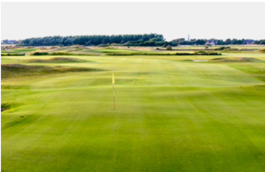
Der küstennahe Links Course des Marine-Golf-Clubs Sylt erstreckt sich auf einer Fläche von 80 Hektar neben dem Flughafen-Gelände vor den Toren Westerland.

Seit mehreren Jahren nimmt der Tourismus in Deutschland zu; 2016 im siebten Jahr in Folge. Einen Grund für den boomenden Deutschland-Urlaub sehen Experten in den vielen Krisenherden weltweit und den daraus resultierenden zunehmenden Sicherheitsbedenken. Besonders inländische Gäste kurbeln das Wachstum an, denn dem Statistischen Bundesamt in Wies-