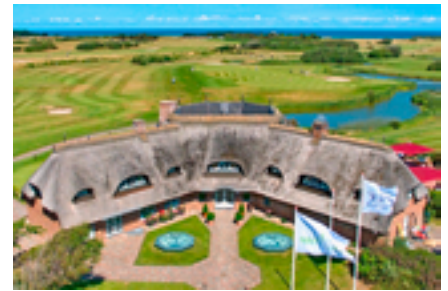
Das 2008 errichtete Clubhaus des Marine-Golf-Clubs Sylt ist als prägnantes Achteck in Holzbauweise gestaltet.

Der Tourismus spielt auf Sylt in allen Bereichen eine große Rolle, so auch im Marine-Golf-Club Sylt. Kein