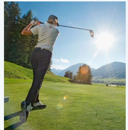
Zuoz-Madulain ist geprägt von einem ständigen, leichten Auf und Ab.

! RR: Zurzeit ist die Anzahl der Golfspieler stagnierend. In den kommenden Jahren könnte sie auch rückläufig werden. Somit wird die Situation nicht einfacher und man ist gefordert, innovativ zu agieren. Auch hier sind regionale Unterschiede zu berücksichtigen, bei uns zum Beispiel ist es von größter Bedeutung, dass auf allen möglichen Kanälen unserer Partnerhotels oder auf Destinationsebene das Golfangebot getragen und (mit-)kommuniziert