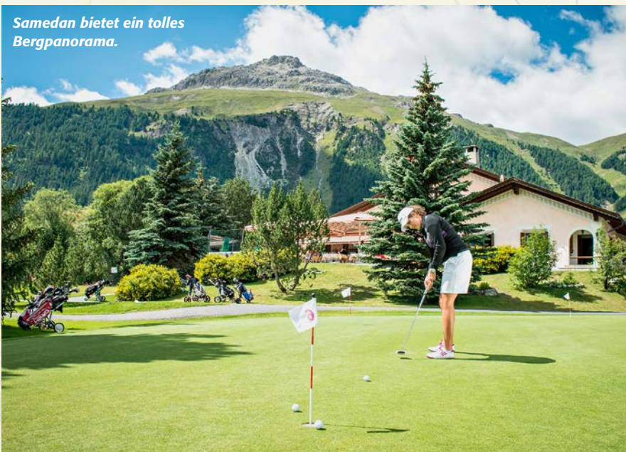
Samedan bietet ein tolles Bergpanorama.

! RR: Teilweise sicherlich, auch bei uns wird Qualität sehr hoch gehalten, und natürlich und zum Glück frequentieren die Gäste, welche in St. Moritz sind, auch unsere Golfanlagen. Dies war und ist noch heute der Fall. Jedoch ist das Engadin nicht nur St. Moritz und bietet für alle und jeden etwas und dies spiegelt sich auch auf unseren Anlagen wider. Es herrscht eine große Vielfaltigkeit, ein Mix. Ich mag an meiner Arbeit insbesondere, dass es ein sehr abwechslungsreicher Beruf ist, mit vielen verschiedenen Facetten und Aufgabenbereichen. Auch gefällt mir der Kontakt mit den verschiedenen Leuten sehr, seien es Gäste oder Mitglieder.